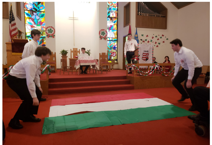
Performance of the Arthur Görgey Boy Scout Troop 14