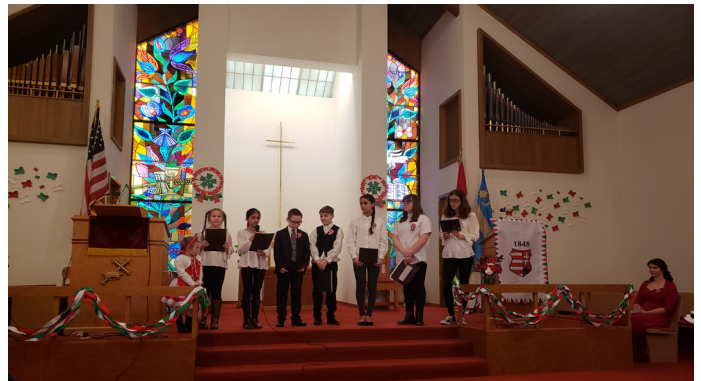
A Nyitott Szívecskék iskolás csoport előadása