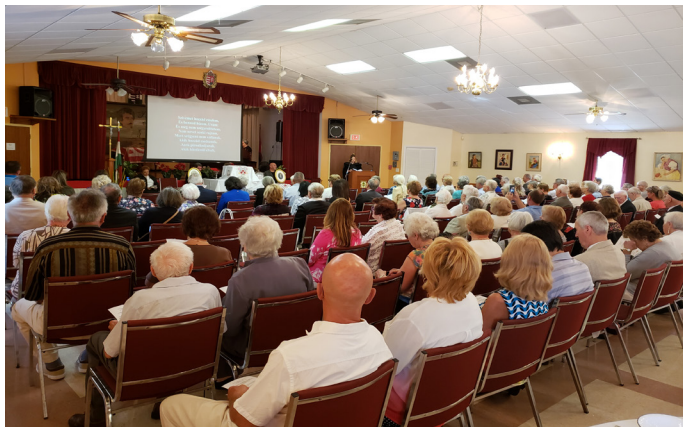
Participants at the Ecumenical Worship Service