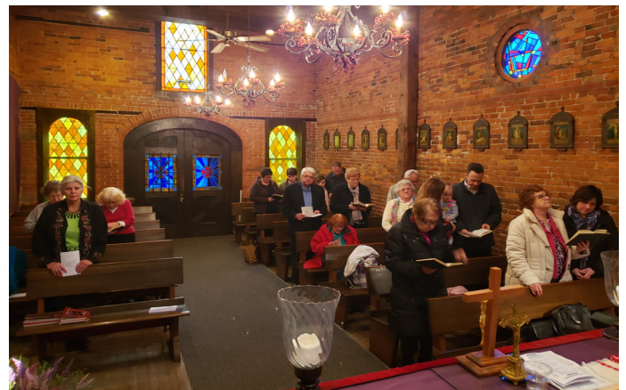
The Buffalo congregation worships the Lord on Palm Sunday at the Saint Jude Center, Buffalo, NY

On Palm Sunday, 2019 we gathered at Chapel of the Saint Jude Center, Buffalo, NY to worship our Lord God in an ecumenical service. We as Hungarian Reformed people believe that God created us being Hungarian, Christ called us to follow him as Reformed, Roman Catholic, or Lutheran believers and we, pastors were called to serve by the Holy Spirit. Hence we gathering in the chapel, and hence the people are coming from different denominations. We are all one as Hungarians, we are all one in the innate need to worship our Lord on the language what our mothers taught to us.