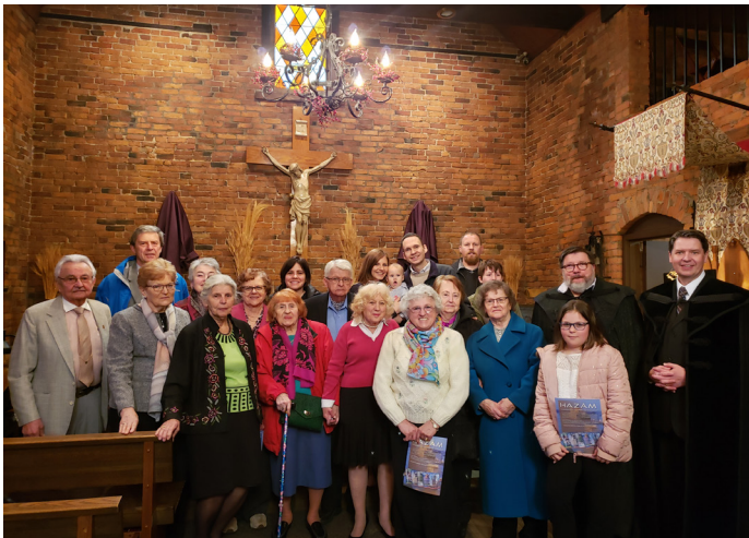
Group picture of the participating members at the Palm Sunday Communion Service