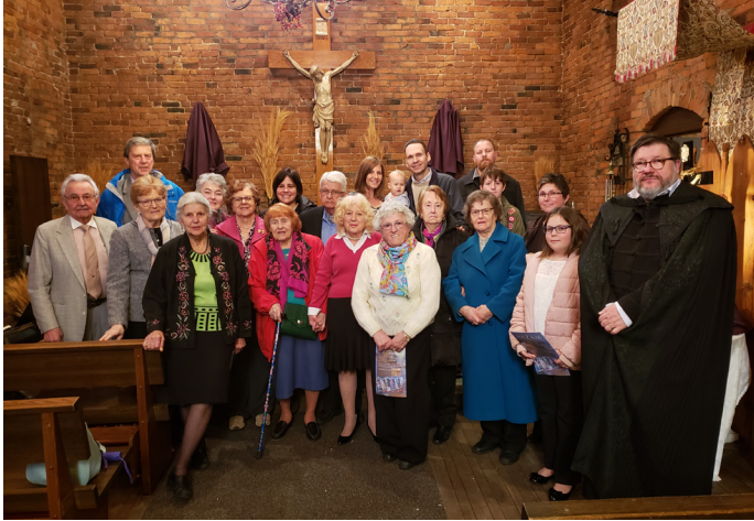
Virágvasárnapot ünneplő buffaló-i gyülekezet tagjai