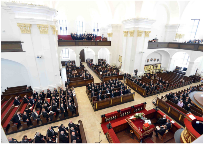
A Magyar Református Egyház Közös Zsinatának ülése 2019. május 17-én a Debreceni Református Nagytemplomban