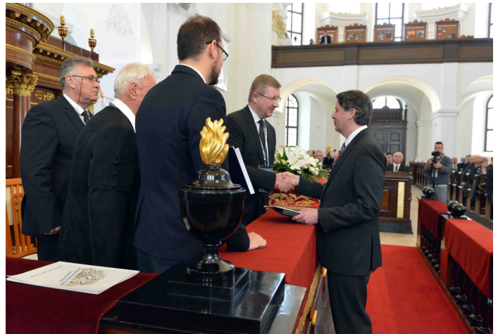
Ft. ifj. dr. Fekete Károly a Tiszántúli Református Egyházkerület püspökének köszöntése és gratulációja

Az elmúlt évszázadban úgy alakult, hogy független gyülekezetek mellett két magyar református egyháztest is működik az Amerikai Egyesült Államokban: az Amerikai Magyar Református Egyház – melynek képviselői tíz éve Debrecenben jelen voltak a Magyar Református Egyház megalakulásánál –, valamint a Krisztus Egyesült Egyházához tartozó, magyar gyülekezeteket tömörítő Kálvin Egyházkerület.