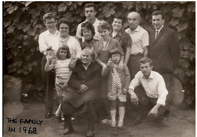
Family trip to Hungary visiting Mom, brothers and sisters, 1968