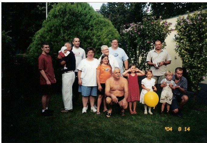
Visiting family in Debrecen, Hungary 2004