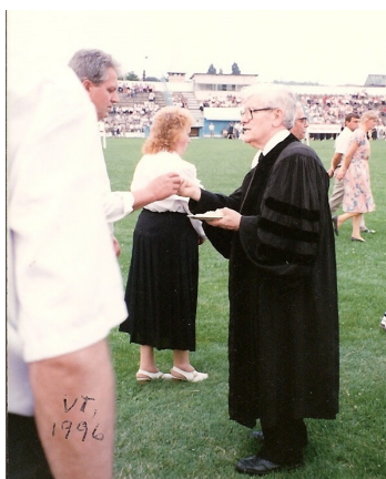
Serving communion at World Conference 1996