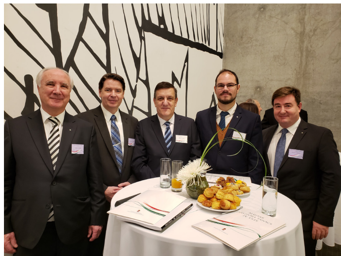
A Várkert Bazárban:

Másnap a diaszpóra magyar szervezeteinek és egyházainak vezetői –összesen 98 hivatalos résztvevő, valamint 13 meghívott megfigyelő– találkoztak a Magyar Diaszpóra Tanács IX. ülésén a Várkert Bazárban.