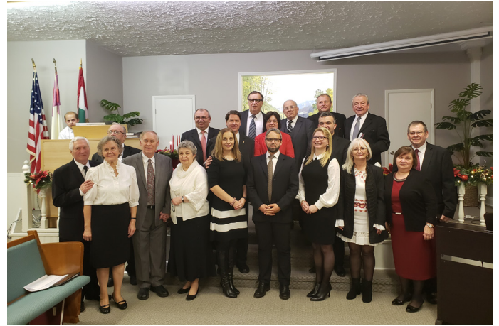
A Clevelandi Magyar Baptista Misszió 120. évfordulóját megünnepelő lelkipásztorok, feleségeik és prominens vendégeik

Istenünk tud létrehozni az ő jelenléte által. Lelkesítő volt látni az egyházak szép összefogását, a szeretet sokféle megnyilvánulását és megerősíteni az együvé tartozás tudatát. Az ünneplés szeretetvendégséggel folytatódott, amelyen szinte minden vendég velünk tartott.