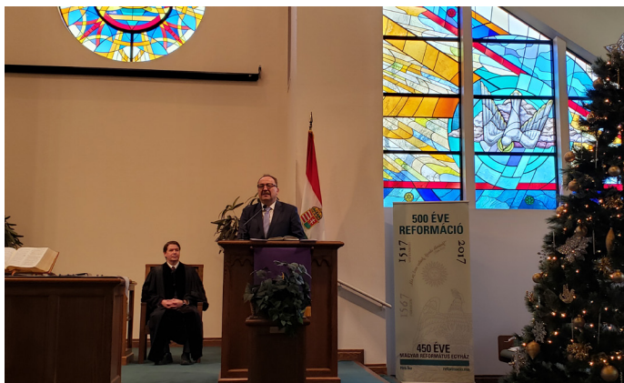
Mr. Zsolt Németh greets the members of the church