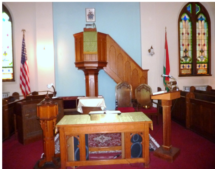
The Sanctuary of the Calvin Hungarian Reformed Church of Woodbridge, NJ