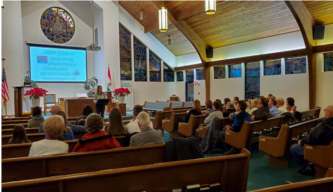
Clevelandi Dicsőítő Est a Walton Hillsi Első Magyar Református Egyháznál

de azért úgy, hogy Istennek is tetsszen, mint „tökéletes áldozat.”