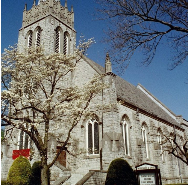
The church building of the United Church of Christ of Bridgeport, CT

During the shutdown, our members made donations of baked goods, food items, personal care items, and prayer shawls for the essential care workers in several local nursing homes and hospitals. Care packages of snacks were donated to St. Vincent's Medical Center, Lord Chamberlain, Cambridge, and Carolton Nursing Homes. Food was donated to the St. Vincent's Mission Services Mobile food pantry. Thanks to all those members who donated and worked on these projects.