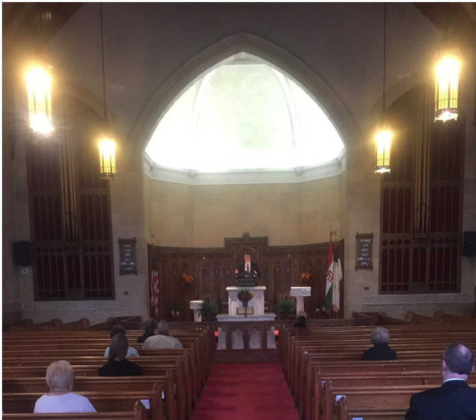
The Sanctuary of the United Church of Christ of Bridgeport, CT

During the shutdown, our members made donations of baked goods, food items, personal care items, and prayer shawls for the essential care workers in several local nursing homes and hospitals. Care packages of snacks were donated to St. Vincent's Medical Center, Lord Chamberlain, Cambridge, and Carolton Nursing Homes. Food was donated to the St. Vincent's Mission Services Mobile food pantry. Thanks to all those members who donated and worked on these projects.