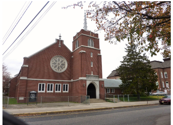
The church building of the Calvin Hungarian Reformed Church of Woodbridge, NJ

Another way that we are reaching out to others is by way of our church website. Many thanks and appreciation go out to our very own Webmaster,