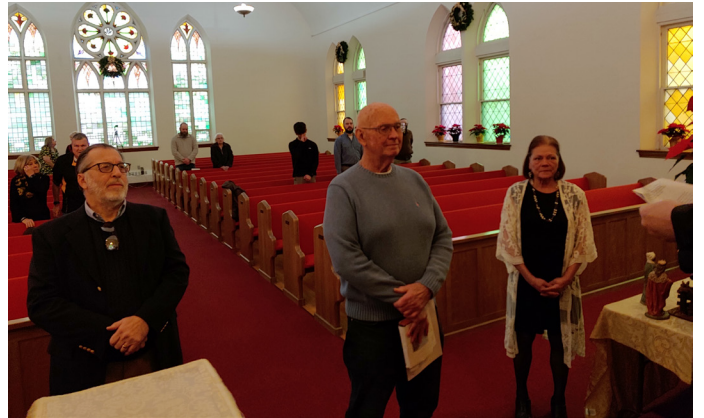
Installation of Consistory elected members

lovely table fellowship while we enjoyed a celebratory brunch in honor of this special day. May God bless the Class of 2024 and guide them as they take on this important calling.