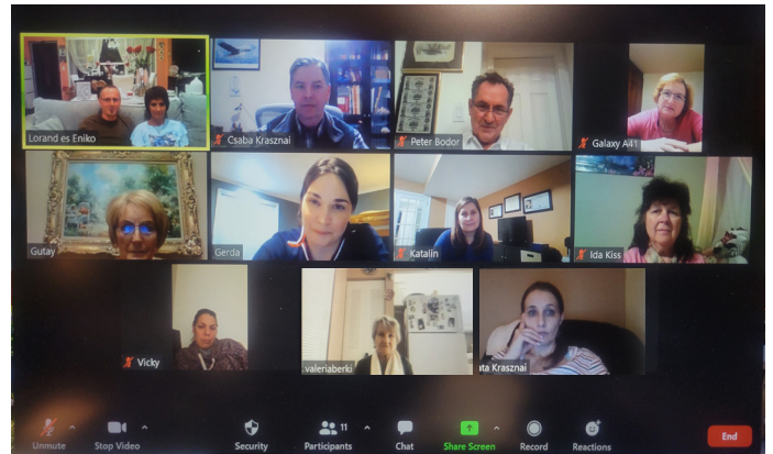
Az online bibliaóra tagjai