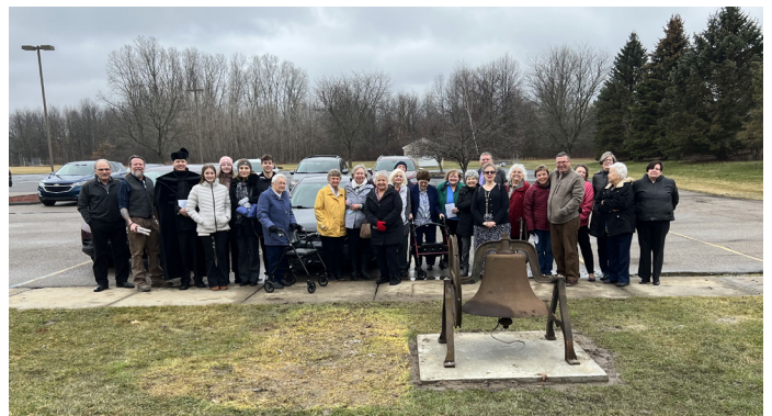
Participating church members and guests at the Historic Church Bell dedication ceremony Continued on Page 10