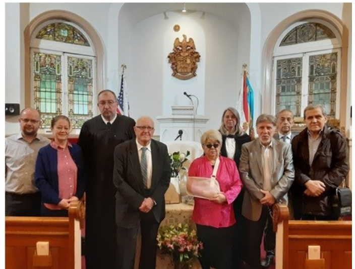
The church's Consistory and ministers.