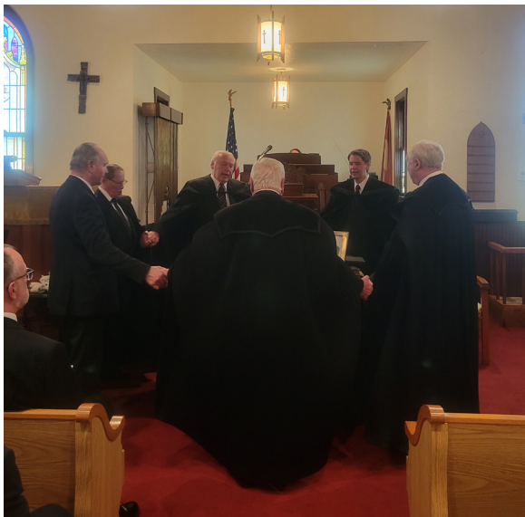
A lelkipásztorok eléneklik búcsúzóul a 65-ik zsoltárt: „A Sionnak hegyén Úr Isten...”

A lelkileg megható istentisztelet végén a jelenlevő lelkészek körbeállták hamvait, és elénekeltük a hagyományos gályarabéneket: „A Sionnak hegyén Úr Isten...”