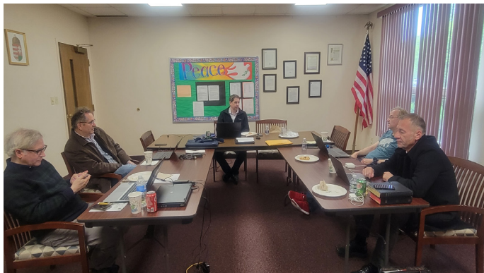
Conference Council members hold their meeting at the First Hungarian Reformed Church, Walton Hills

These full two days bonded the Council members into a positive and trustworthy leadership group. One of the most important tasks was to prepare the Agenda for the 81 st Synod Meeting that will be held again at The First Hungarian Reformed Church, Walton Hills at the end of August.