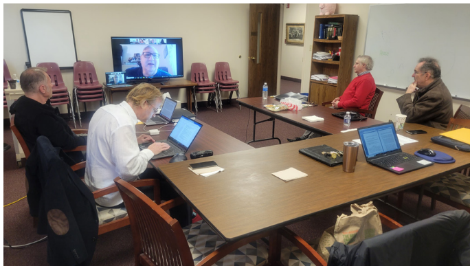
Calvin Synod Conference Council and Budget and Finance Committee combined Zoom and in-person meeting

On Saturday night, the Conference Council represented the Calvin Synod at the 66 th Annual Hungarian Scout Benefit Ball. The members of the Calvin Synod Conference Council were officially greeted. We were pleased to participate at this remarkable event in the life of the Hungarian Scouts and the Cleveland Hungarians.