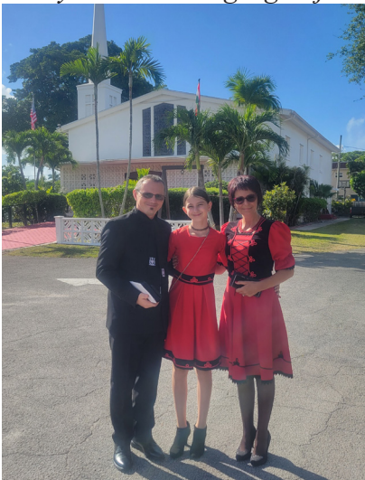
A lelkészcsalád a Miami-i Krisztus Magyar Egyház temploma előtt