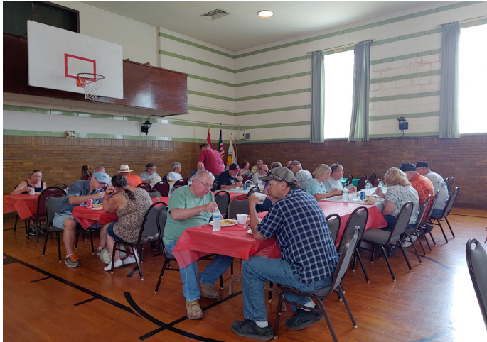
The first 50 participants of the Blessing of the Fleet were offered delicious Chicken Paprikas Dinner